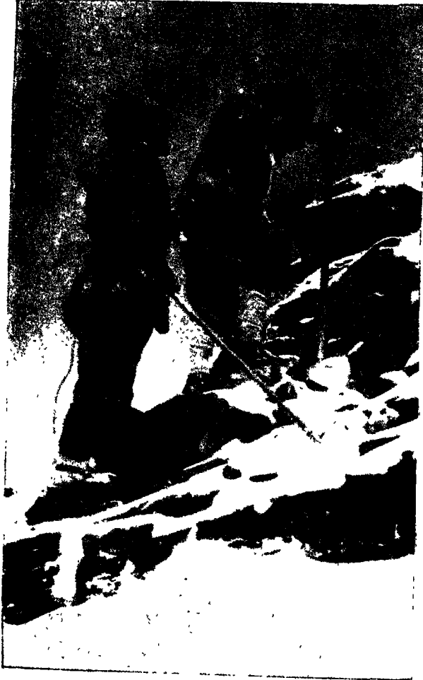
मलेरी और नार्टन